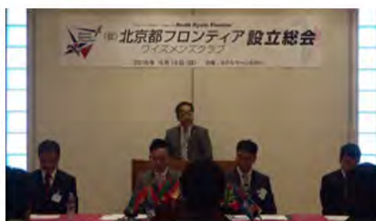
北京都フロンティアクラブ設立総会

今期の私の主題は「いつも喜んでいなさい」というものでした。聖書にでてくる言葉です。パウロがはるばるテサロニケ(今のギリシャの都市)に暮らす信徒へ送った手紙の一節です。この言葉は次に「絶えず祈りなさい、そして、すべてのことに感謝しなさい」と続いています。部長は自分だけの思いや力ではできません。クラブのみなさん、支えていただいた京都部のみなさん、ほんとうにありがとうございました。